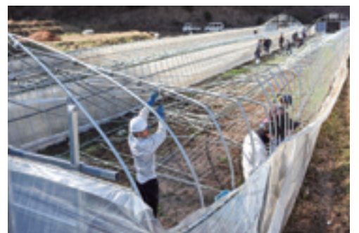
▲ビニールハウスを撤去するJ A職員

J A管内では12月下旬と1月下旬に大雪を記録しました。生産拡大を進めるハウレンソウやアスパラガスなどでハウスが倒