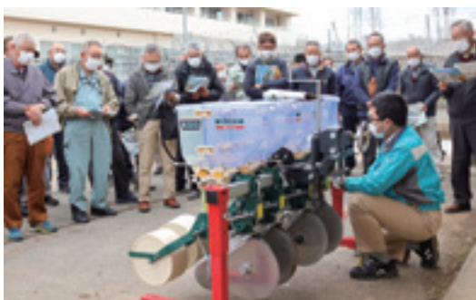
▲説明を聞く参加者

J A全農ひろしまが農作業事故の発生件数や要因、安全作業に向けたチェックシートなどを説明しました。県は麦、大豆の動向と麦栽培などを説明し、中国四国ボタは、ムギの施肥播種機やICT(情報通信技術)を融