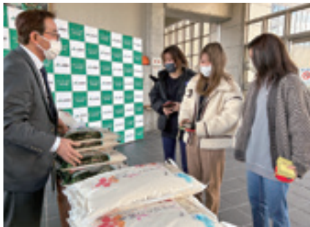
▲食料を受け取る大学生

支援は2020年度に始め、庄原市の県立広島大学庄原キャンパスと県立農業技術高等学校の学生が対象です。「広島県庄原産東城こしひかり」「広島県庄原